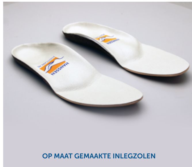
OP MAAT GEMAAKTE INLEGGZOLEN